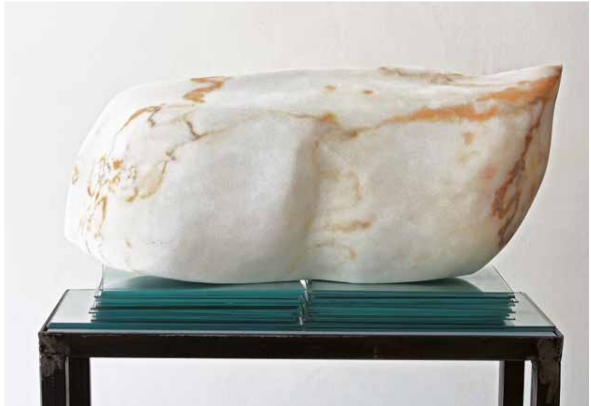
„Einer trage die Last II“; Marmor/Glas, 60 x 20 x 31 cm, 2015

Seit 1981 zahlreiche Gemeinschafts- und Einzelausstellungen von Skulptur und Grafik. Plastische und grafische Arbeiten im privaten und öffentlichen Besitz.