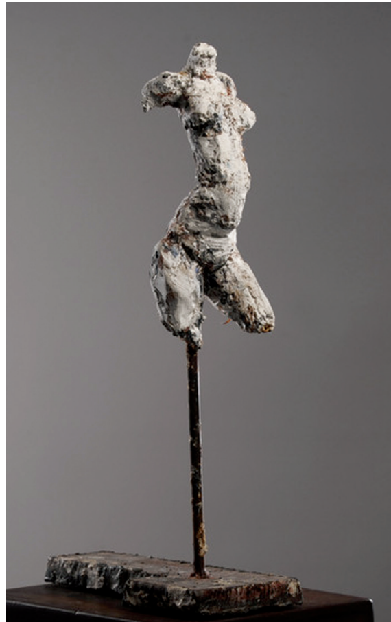
„Extensio“; Gips kaschiert, 50 cm, 1993

Zahlreiche Skulpturen im öffentlichen und privaten Raum, sowie internationale Ausstellungen.