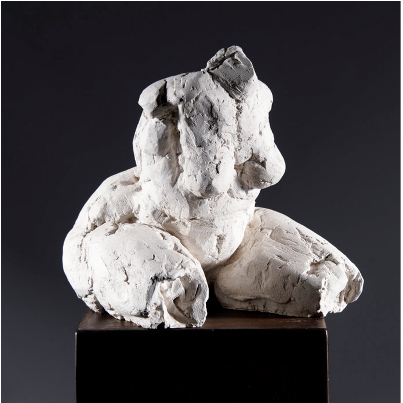
„Assessus“; Gips abgeformt, 30 cm, 1998