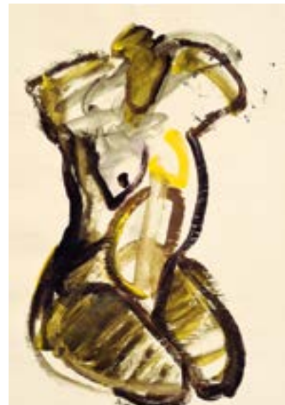
„Akt mit gelber linker Brust“; Acryl auf Papier, 58 x 42 cm, 2016