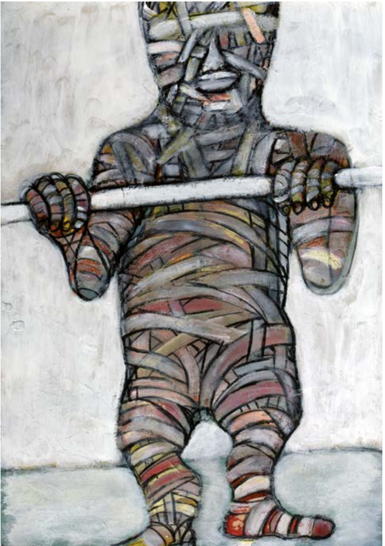
„Der Mullbindenmann“; Acryl auf Papier, 58 x 42 cm, 2016