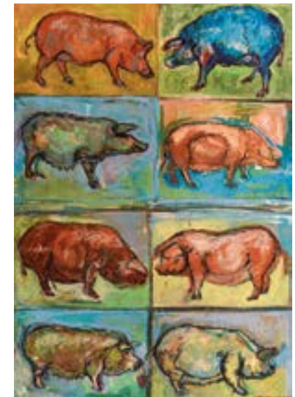
„Kein Schwein ruft mich an, keine Sau interessiert sich für mich ...“; Acryl auf Papier, 58 x 42 cm, 2015