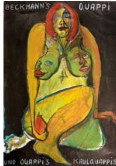
„Beckmann's Quappi und Quappi's Kaulquappis“; Acryl auf Papier, 58 x 42 cm, 2015

Künstlerische Schwerpunkte: Aktzeichnen und Malerei