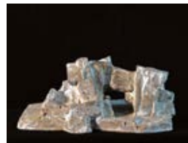
„Gestürzt“; Beton, 14 x 20 x 22 cm, 2004