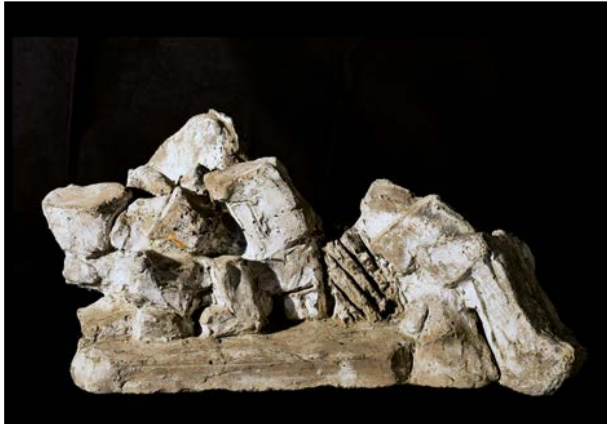
„Kräfte von rechts“; Beton, 15 x 35 x 21 cm, 2004